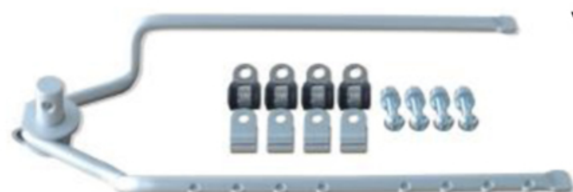
Kupplungsbügel mit Befestigungselemente

Bitte lesen Sie die folgenden Sicherheitshinweise und Beschreibungen vor der Verwendung des Produktes sorgsam durch.