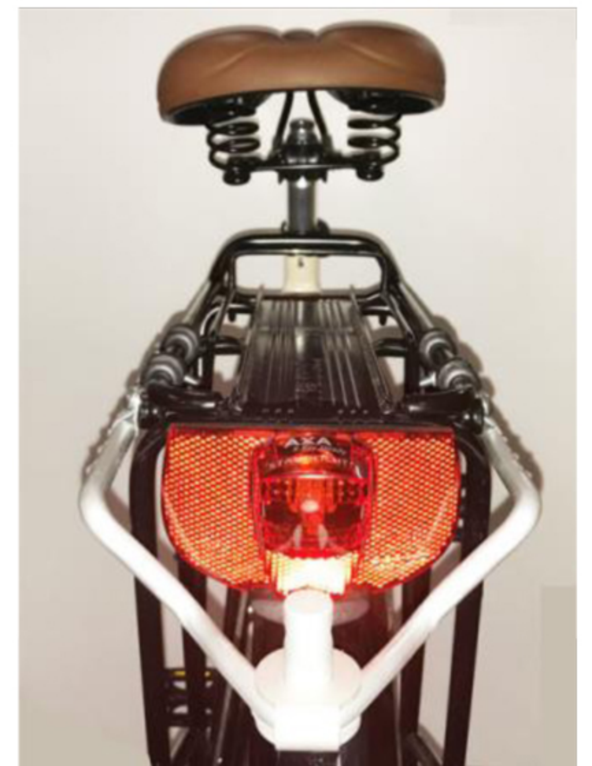
Bild: Das Rücklicht und der Reflektor Ihres Fahrrades muss beim Betrieb ohne Anhänger zur Gänze sichtbar sein!

Sollte Ihr Rücklicht durch den Kupplungsbügel verdeckt werden so können geschulte Fachkräfte das Rücklicht Ihres Fahrrades versetzen oder ein zusätzliches anbringen.