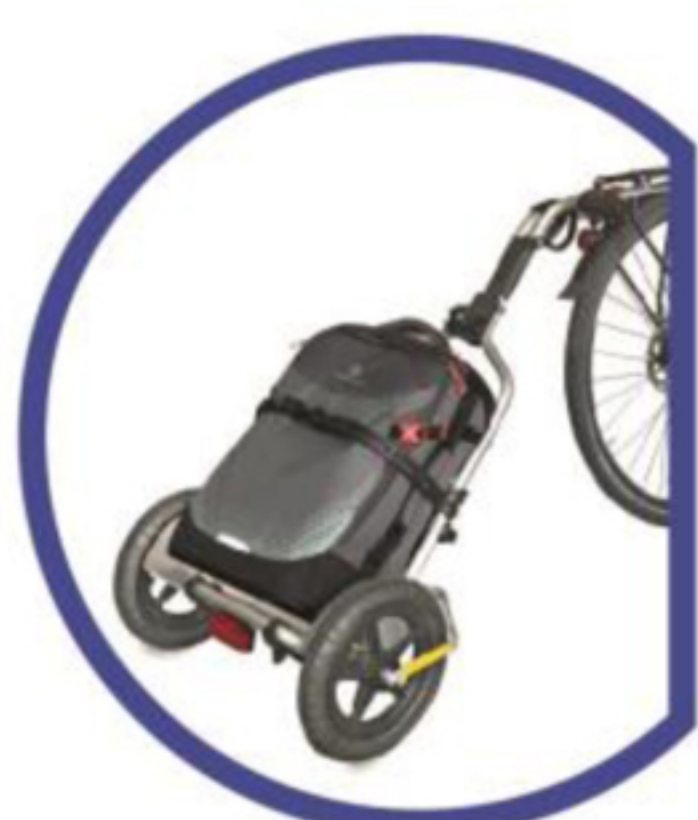
Für Taschen & Rucksäcke