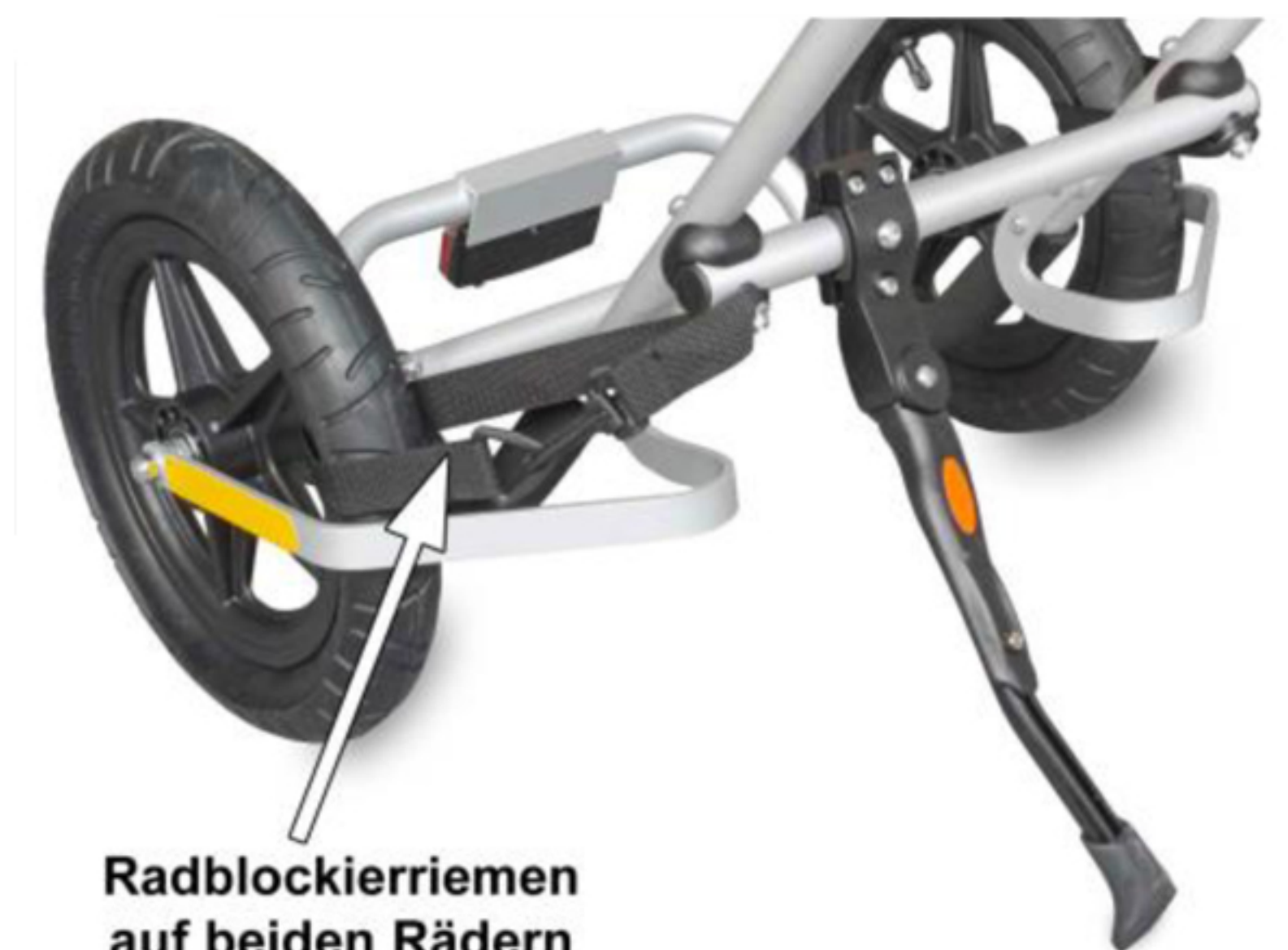
Radblocierriemen auf beiden Rädern

Achten Sie bei geneigten Fahrbahnen oder beim Beladen, dass sich der Fahrradanhänger nicht selbstständig in Bewegung versetzen kann und u.U. auch das Fahrrad mit sich ziehen kann. Sichern Sie daher auf geneigten Flächen beide Räder des Anhängers mit den beiden Feststellriemen des Anhängers.