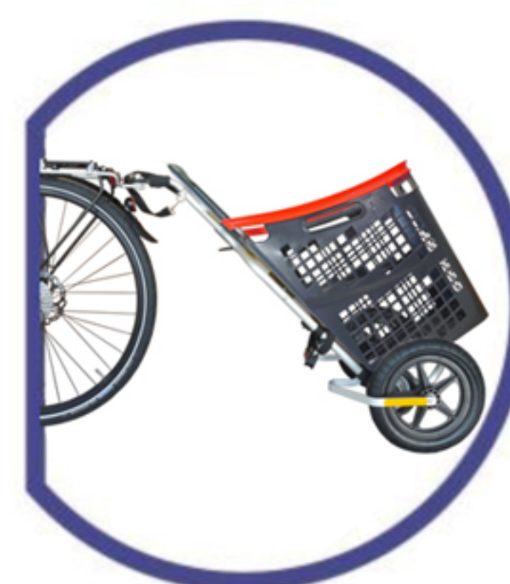
Fahrradanhänger & Handwagen